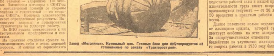
Завод «Металликот». Котельный цех. Готовые бани для котлоагрегатов из готовельной по заказу «Трансгострой».

«В связи с ускорением жилищного строительства в городе и деревне к 1-му мая 1935 года необходимо принять срочные меры по ускорению жилищного строительства в городе и деревне к 1-му мая 1935 года.»