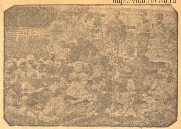
Сталинградским промредсоюзом организована в подшафном колхозе на хуторе Гормосино дотплощадка. На снимке — дети колхозников и обслу живающий персонал.