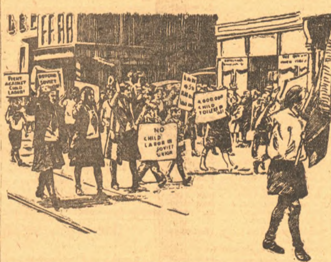
Демонстрация пионеров Нью-Йорка, проходившая под лозунгом борьбы против детского труда. Дети несут плакат с надписями: «4.000.000 детей работает в САСШ», «в Советском Союзе нет детского труда», «боритесь против детского труда».

ЛОНДОН. В Хенри 1000 рабочих прошли по улицам города. Демонстрация была единогласно принята резолюция осуждения «контрактационного» правительства и митинг оппозиции лейбористской партии, которая оказывает помощь национальному правительству, стремясь подавить борьбу всех вне стен парламента. В Сильвердове (?) 3000 тысяч рабочих устроили демонстрацию по главе которой шли революционные работницы с красными флагами. В Лаворгане 600 человек, явившихся на митинг, созданный местным отделом Южно-Уэльской реформистской Федерации горняков превратились в митинг совместно с другими пролетарскими организациями для подготовки массовой борьбы против мероприятий национального правительства. В Средней Ронде (Южный Уэльс) оружейный комитет действия созывает конференцию всех рабочих организаций округа с аналогичной же целью.