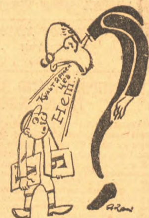
Неграмотные требуют культармейцев, а им заявляют, что культармейцев в Томске нет.

Там имеются около 800 неграмотных и малограмотных. Обучается — 40 человек. Горсовхоз. В районе Степановки из 80 неграмотных и малограмотных никто не занимается летом, не занимаются и сейчас. В районе станции Томск II надо обучать не менее 200 человек. Они не занимались и не занимаются. Станция Томск II, завод „Металлист“ — никто не учится. Фабрика „Сибирь“ — 2 студента еще летом в течение 4-х дней пытались организовать работу по ликбезу, но фаззавтражником упрямо не хотел принять в этом участия и работа сорвалась. На Госмельнице 87 рабочих (неграмотных и малограмотных) желают, давно желают учиться, но работники ликбеза пытаются нам доказать, что некого послать их обучать (вы, слышите, в Томске некого послать на ликбезработу, в Томске не могут найти культармейцев). Только полной бездеятельностью Горсовнарпроса, КРО, профсоюзных и комсомольских организаций можно объяснить это чудовищное безобразие на культурном фронте. Много городов, промышленных центров рабочих поселков других краев и областей давно уже поковались с неграмотностью. В Томске имеются две возможности чтобы добиться прекращения города в город сплошной грамотности к 14-ой годовщине Октябрьской революции. Но исключительная бездеятельность и безответственность Горсовнарпроса, КРО, беззаботность городских организаций привели Томск к таким позорным результатам.