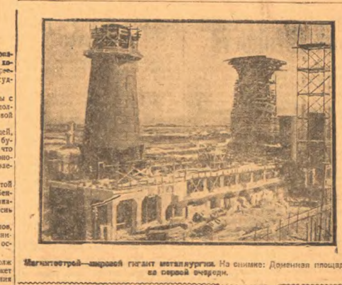
Металлургический — огромный гигант металлургии. На снимке: Домениан прокладывает дорогу.

Некоторым примером может служить механический институт. Паровозы и т.д.