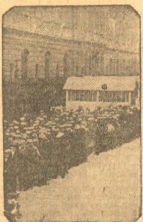
Очередь безработных перед столовой, где они получают дешевый обед.