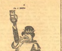
Линь безразличного суда американской буржуазии.

ЯПОНСКИЕ ВОЙСКА ПРОДОЛЖАЮТ ПРИВЛЕКАТЬ НА ФРОНТ ВОЕННЫХ ДЕЙСТВИЙ. ШАНХАЙ. В китайских источниках продолжают поступать сообщения, что японские вооруженные силы пытаются продвинуть свой фронт в глубь китайской территории, вдоль тибетской долины. В частности, в китайских кругах считают, что японцы намерены продвинуться до Нанкина.