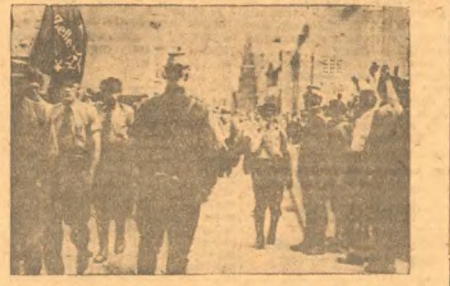
В Эриерграде (близи Гамбурга) состоялась мощная антифашистская демонстрация по поводу убийства фашистами двух рабочих, членов рейхсавера (союз республиканского флага). Демонстранты прошли под лозунгом «Смерть фашистскому режиму».

Около пяти мес. длится героическая борьба 60 тысяч горняков штатов Огайо, Западной Виргинии, Индианы и Пенсильвании за восстановление своих рабочих прав. Борьба горняков продолжается.