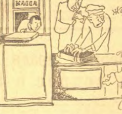
ЖАЛОБУ КНИГУ НЕ РАЗРЕШУ!

16. Милиция должна была провести работу по выяснению обстоятельств кражи и по привлечению виновных к ответственности.