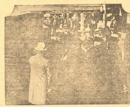
Третьялтышная демонстрация протеста состоялась в Нью-Йорке перед домом султана Османа Орпана, приговора в 1918 году к смертной казни. Демонстрация была направлена против гитлеровской диктатуры и ее политики.

Помощь китайским партизанам. Британский комитет по делам Китая с помощью своих средств оказал помощь китайским партизанам. Комитет выделил 20 миллионов долларов на покупку оружия и боеприпасов. Комитет также оказал помощь китайским партизанам в других областях.