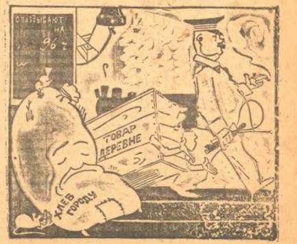
Там еще работают на некоторых участках Томской дороги.