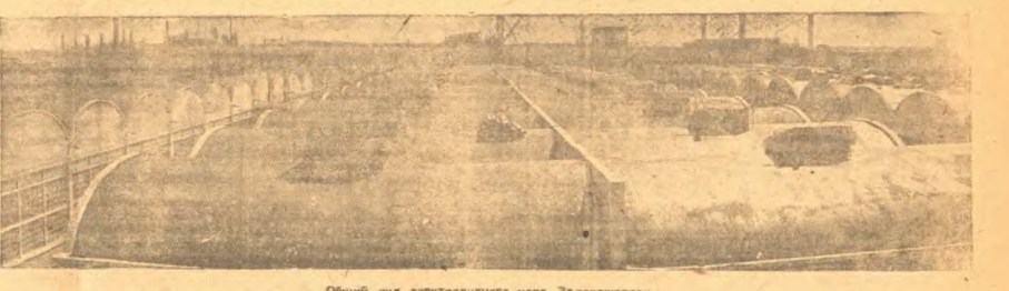
Общий вид электростанции цеха Запорожстали.