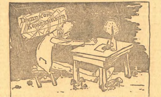
Не много лиц мне память сохранила, не много слов доходит до меня.

В группках может быть, нет сводки по только об ударниках, но даже о членах профсоюза