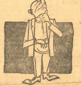
—Весь вопрос в том, где достать для рулона рулонной бумаги.