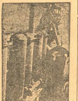
Магнитогорский металлургический завод. Комсомольская ячейка.

МОСКВА. Совнарком СССР постановил назначить Осинского Валерия Валерьевича председателем государственной комиссии по определению урожайности, размеров валового сбора зерновых культур при СНК СССР.