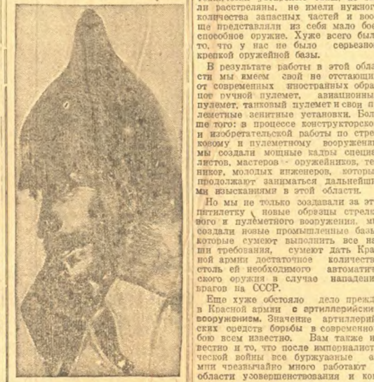
Тов. Сталин в 1920 году на южном фронте.

В результате работы в этой области мы имеем в настоящее время в армии созданы мощные кадры специалистов, мастеров — оружейников, техников, молодых инженеров, которые продолжают заниматься дальнейшим совершенствованием в этой области.