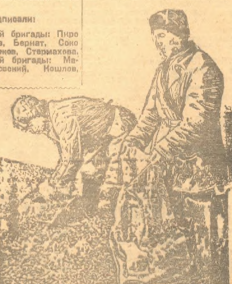
Сельки отсортировочного совхозного колхоза „Антиант“, Томского сельсовета.

30-го апреля, в 7 час. веч., в помещении городского театра СОСТОИТСЯ