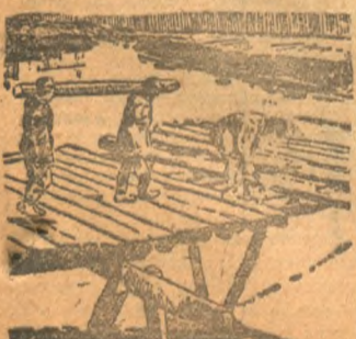
Ремонт грунтовых дорог. Постройка нового моста.