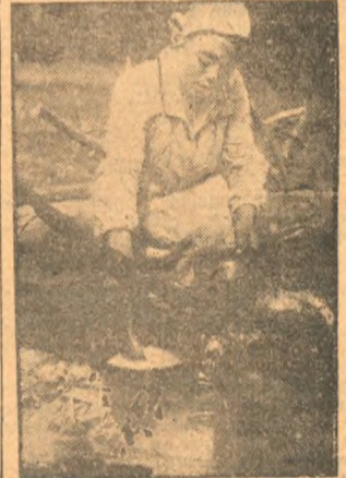
Колбихинский колхоз организует общ. питание на полях. На снимке: У. котла.

Данные сводки говорят прежде всего о том, что темпы сенокосения за третью пятидневку значительно повысились и переярив повозов отставали второй пяти-