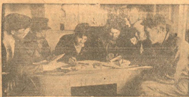
Подписание договора представителями Колбихинского и Сухореченского сельсоветов.

КОЛБИХА. Между колхозами Колбихинского и Сухореченского сельсоветов заключен социалистический договор на лучшую подготовку и проведение хлебосдачи и поставку зерна государству. Основные условия договора таковы: подготовка уборочного инвентаря