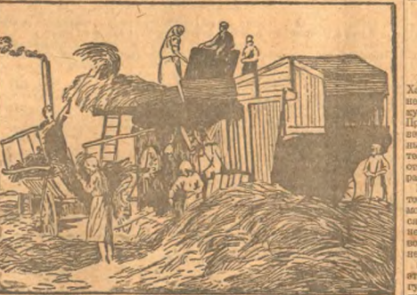
УРАНА. С первых-же дней уборки пашены в ход сложены молотильные агрегаты, развешены дорняки сача зерногосударству. (Тасе).

Проложила и борьба с вредителями в пригородных хозяйствах с самого начала были развешены и проведены очень плохо. В результате отплодилось в большом количестве сорная дичья мушкетера зашла на поля колхоза МЗС и погубила значительную часть овощей — и земля, капуста и даже арбузы.