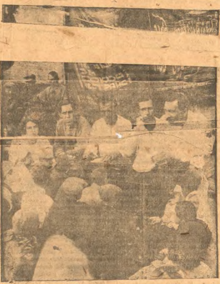
Рабочие Союзтранса, за обсуждением импортируемой в республику себестоимости на своей производственной конференции.

В результате помещенного в газете «Красная Звезда» ряда заметок и записок на черную доску коллектива восточной бригады приняты решительные меры по ликвидации нарушений.