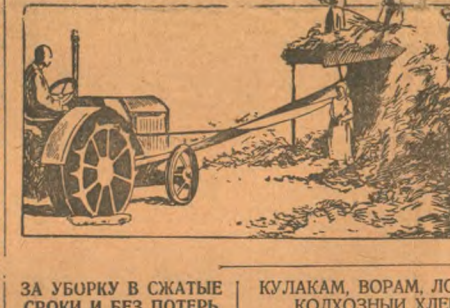
ЗА УБОРКУ В СЖАТЫЕ СРОКИ И БЕЗ ПОТЕРЬ