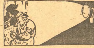
Лондонский суд осветил процесс в Лейпциге.

ЛОНДОН. Общественный суд по делу о поджоге рейхстага по сле разбора всех обстоятельств дела пришел к следующим выводам: Ван-дер-Люббе не являлся членом компартии и противник этой партии. Нет никаких связей между компартией и поджогом рейхстага. Обвинения Гатлера, Димитрова, Попова, Тане не подлежат рассмотрению, как ни по, так только не виновные в приписываемых им преступлениях, но также, как и не замешанных в нем или косвенно к поджогу рейхстага.