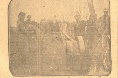
Молодцы „Путь Сталина“, Петуховского сельсовета, проводят молотбы 2 смены, используя нефтяной двигатель. В сутки молотят по 15 раз.