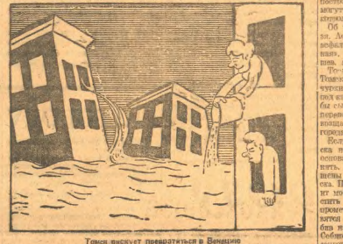
Томск ищет превратиться в Венецию