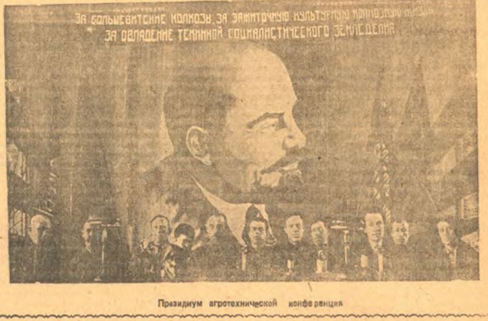
Праздник агротехнической конференции

В заключение хотелось бы отметить активное участие делегатов в решении вопросов, связанных с повышением урожайности и механизацией сельского хозяйства. Это свидетельствует о высокой ответственности работников и их готовности к труду на благо родины.