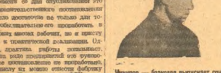
Чкурю — бригаду выпускает сию чулу без парфина.