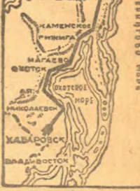
Полет хабаровских летчиков. Хабаровск 29 марта экипаж Пашковский канал в Хабаровске. Дневной вылет экипажа Пашковский канал в Хабаровске. Дневной вылет экипажа Пашковский канал в Хабаровске.

29 марта «Красин» покинул берега Голяндкии в направлении бухты 800 тонн. С этими грузами он идет в Мурманск. Буксир Голландский пароход Пашковский канал, Голяндский пароход Пашковский канал, Голяндский пароход Пашковский канал.