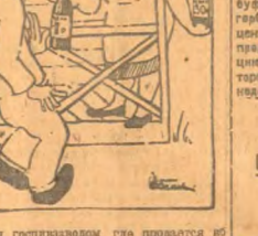
„Заварил квас“ РОКК