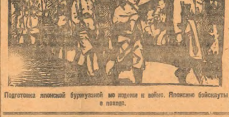
Подготовка японской буржуазии во лдены и войне. Японские бойскауты в походе.

БЕРЛИН. Гитлер в приказе выданным штабу штурмовых отрядов являясь предостерегает «свои борю против разложения, против распытия ресурсов штурмовых отрядов обуюею военных средств. Гитлер указывает, что он требует от руководителей подлого повиновения и безусловной дисциплины. Гитлер предостерегает руководителей «принимать свои силы в той области, которая им отведена, а не в той, которая относится к компетенции других». Тем самым приказ резко ограничивает функции и компетенцию руководителей штурмовых отрядов и являясь знакомым. Гитлер требует также от руководителей «абсолютного повиновения и верности рейсера».