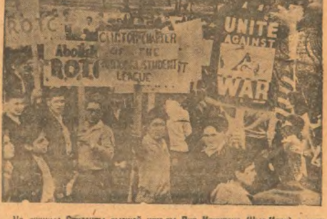
На снимке: Студенты высшей школы Вит Кинттона (Нью-Йорк) с антивоенными плакатами.