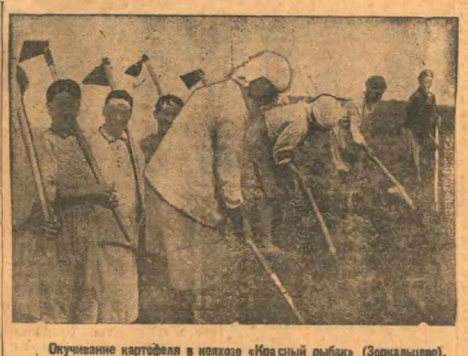
Посадка картофеля в поле «Красный рыбак» (Зорянский).

Было немало социалистическое соревнование! На лучшее обслуживание питания! Добьись первенства во всеобщем конкурсе!