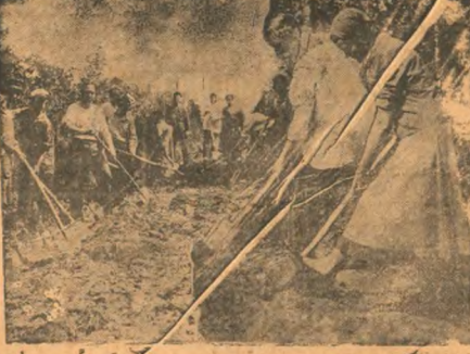
На субботнике в Парке культуры и отдыха на Басманной.

ПРАГА. Несмотря на опровержения австрийского правительства, последние исследования утверждают, что в долине Штебера процветают огромные стволы.