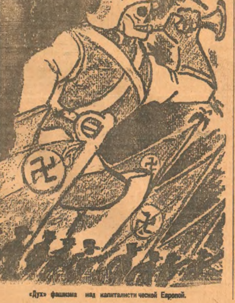
«Дух» фашизма над капиталистами чешской Европы.