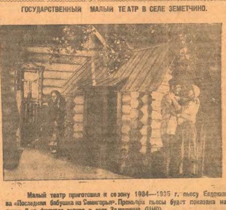
Малый театр подготовил к сезону 1934—1935 г. пьесу Ездарева...

— Клепкин не виноват, — с отеческим сожалением говорит т. Ленин.