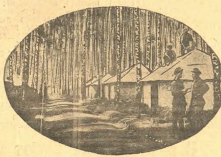
В лагерях Осо. Вновь выстроенные фанерные палатки.

За первое полугодие текущего года низовые печати нашего района увеличились на много выросло. В районе насчитывается свыше 500 стеновых газет и 7 много-тираниж.