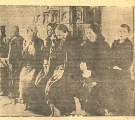
Огромное наводнение в Польше, в особенности на юге, причинило массовые огромные убытки. В результате этой катастрофы более, чем 200 тысяч человек очутились без крова и хлеба. На снимке: Крестынианская беднота на одном из спасательных пунктов.