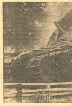
С целью испытания мощи современных танков, во время маневров американской армии в штате Джорджия, специально были построены крепкие дома. Испытания показали, что танки легко и свободно «проходят» сквозь стены этих домов. На снимке: Американский танк на маневрах.