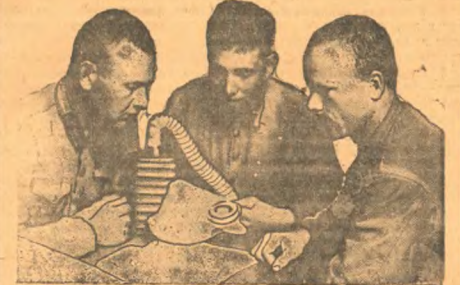
Студенты — командиры изучают противояз.