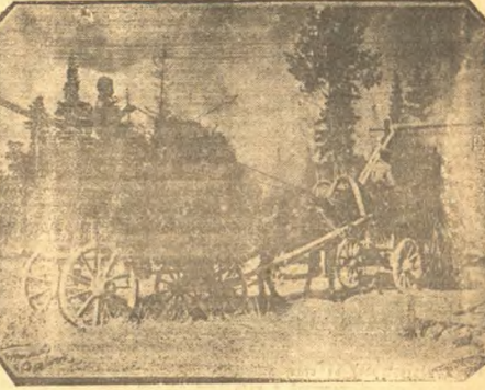
Половина отцов и внуков социализма (колхоз «Сигнал», Калининского сельсовета).