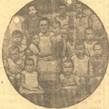
Дети колхозников в яслях (колхоз «3-й революций», Киреево).