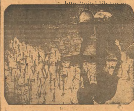
Рисовые поля в Японии возделывают селестариннее — вручную. С утра до вечера в воде, часто под палящими зноями — таковы обычные условия работы. Жестоко эксплуатировать крестьян живут в бедности и нищете, но в будучи в состоянии удовлетворять их нереальные потребности.