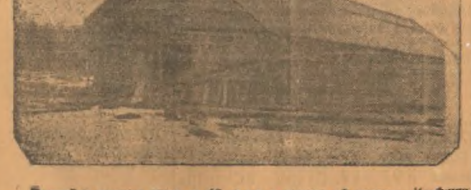
Постройка стального дера на 40 го лее в колхозе «8 марта». Наблюдательного сельсовета

Артель «Варшак» заставляла зимой продавать. Зависит норма для лошадей отсутствуют. Были случаи тов.