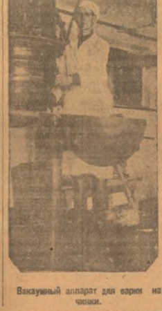
Вакуумный аппарат для варки из чугуна.