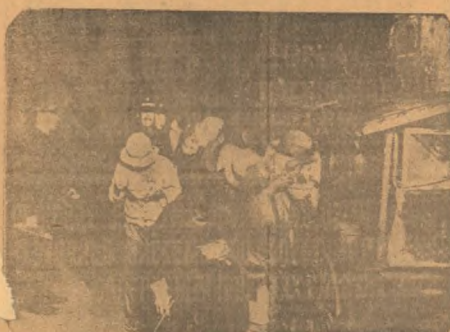
На снимке: Парадная форма благодетельной организации раздает безработным горючий суп.