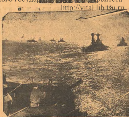
На снимке: Морской флот США, возвращающийся в базу в Калифорнию после маневров в Атлантическом океане. Эскадра делает поворот перед входом на рейд Лос-Анжелес.