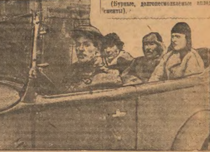
На снимке: Делегаты съезда колхозников-ударников вступают в гостиницу на заседание съезда.

Товарищи, как вы знаете, в последние годы в нашей стране достигли огромных успехов в области науки и техники. Эти успехи достигнуты благодаря труду ученых и инженеров. Эти успехи достигнуты благодаря труду ученых и инженеров.