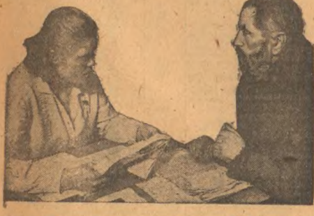
Секретарь Центрального комитета ВКП(б) и Председатель ЦК ВКП(б) тов. И. В. Сталин.