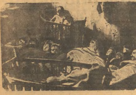
Женщина горюха в Борнине, (Бельгия). В момент высту три сына.