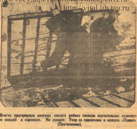
Многие пригородные колхозы нашего района поселили значительное количество овец в парниках. На снимке: Ухова за парниками в колхозе «Планиста» (Протополье).