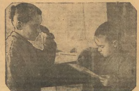
Бабушка ученица 2-в кл. Гены Баба лечит — пенсионерка. Она активно участвует и интересуется жизнью своих детей.

Нежная забота — это любовь и внимание. Это то, что нужно каждому человеку. Без заботы человек не может жить. Нежная забота — это то, что делает жизнь прекрасной. Это то, что дает нам силы и勇气. Нежная забота — это счастье. Нежная забота — это то, что нужно родителям своим детям. Это то, что нужно учителям своим ученикам. Нежная забота — это любовь.