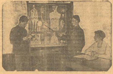
На испытаниях по естественным в средней школе № 3.

Плоды одной победы — это мир и благополучие. Это то, что мы хотим видеть в мире. Это то, что мы хотим видеть в нашей стране. Плоды одной победы — это то, что дает нам надежду. Это то, что дает нам уверенность. Плоды одной победы — это счастье. Плоды одной победы — это то, что нужно всем людям. Это то, что нужно всем народам. Плоды одной победы — это любовь.