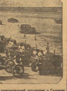
На снимке: Изюмы американской морской артиллерии в Гомолу.