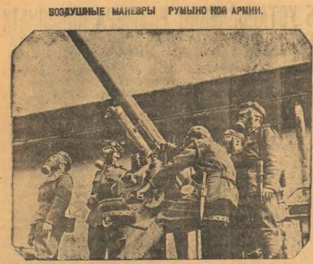
На сцене: Зенитная батарея с артиллеристами в противогазах на маневры противозушной обороны в Бухаресте.