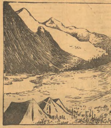
Патер в долине горы Белуха.