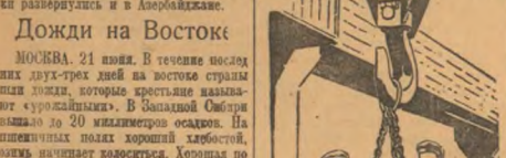
Центы для работ по постройке второй очереди Московского метро.

ВНЕД. 20 июня. В работе промышленности большие перспективы. Открыты новые залежи угля на Урале.