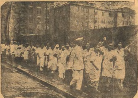
На снимке: демонстрация выходящих работниц в Тонки, требующих повышения зарплат.