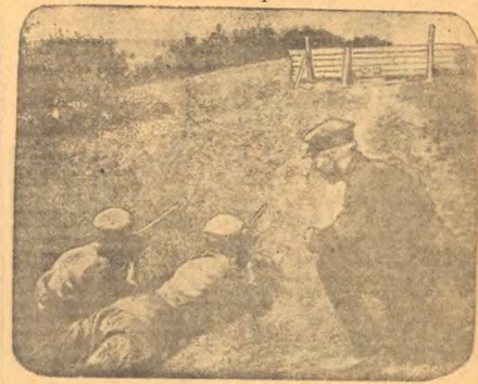
Летом в поле широко развернуты стрельбы в системе Гербицидов. На снимке — стрельба из мелкалиберных винтовок на дистанции 30 м.