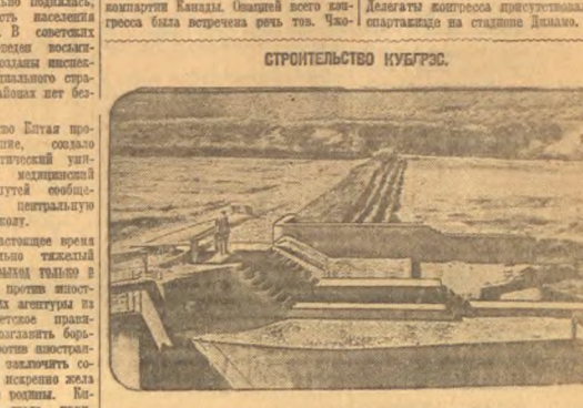
На снимке: пастрейка плетеной КубГРС.