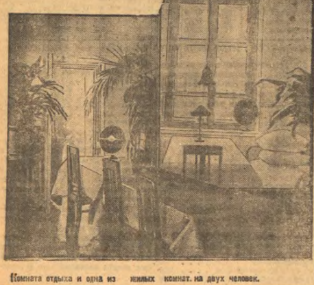
Комната отдыха и одна из новых комнат на двух человек.