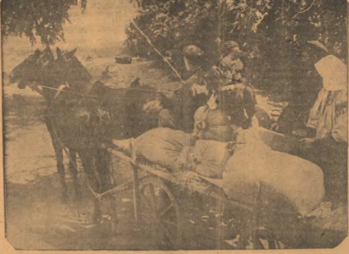
Колхоз им. Сталина (Кривошольский район, Винницкая область) выкатил плечи дробосеки и заканчивает выкаты ленточной дробилки.