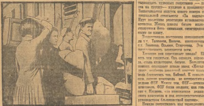
Отправка томских комсомольцев на строительство железной дороги Эйка-Сонур.

«— Несколько раз...» «Особенно мне нравятся очень трудные...»