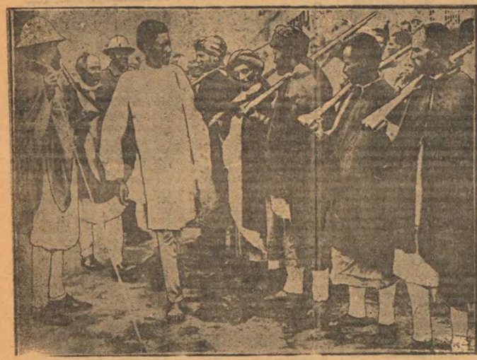
В Абиссину прибывают группы добровольцев из провинции, чтобы вступить в ряды абиссинских войск. На снимке: группа добровольцев под маршем по дороге.