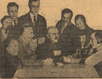
Руководители горрайкома и горкома ВЛКСМ беседуют с молодежью в техникуме и отличниках.

Мы должны использовать все это для стахановцев. Мы должны использовать все это для стахановцев. Мы должны использовать все это для стахановцев.