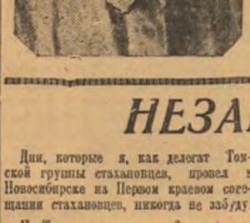
Спасибо своему заводу Иришину.

После этого совещания у каждого из нас появилось желание поехать в ту или иную страну, дабы увидеть, насколько она развита, чтобы сравнить ее с нашей страной. Но ведь это было бы несправедливо, потому что мы знаем, что наша страна — самая развитая страна в мире. Мы знаем, что наша страна — самая развитая страна в мире. Задача всех партийных, комсомольских и профсоюзных организаций заключается в том, чтобы помочь и поддержать тех, кто стремится к успеху в своей работе. Сейчас у нас в стране много таких работников, которые стремятся к успеху в своей работе. Они стремятся к успеху в своей работе. Они стремятся к успеху в своей работе. Сейчас у нас в стране много таких работников, которые стремятся к успеху в своей работе. Они стремятся к успеху в своей работе. Они стремятся к успеху в своей работе.