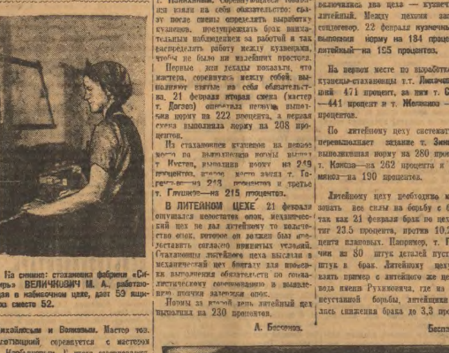
На сцене: станочники фабрики «Сибирь» ВЕИНОЧНИК М. А. Работают в механическом цехе, да 59 процентов сверх нормы на 148 процентов.

В МЕХАНИЧЕСКОМ ЦЕХЕ 21 февраля состоялся отчет о выполнении задания на 222 процента.