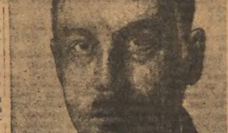
Товарищи Сталин, товарищи Ворошилов, товарищи Молотов и товарищи Берия...

За два года 1934—35 г. больше чем за 19 колхозников годов выросло стадо крупного рогатого скота в нашей стране.