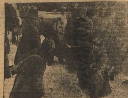
Товарищи Сталин, товарищи Ворошилов, товарищи Молотов и товарищи Берия...