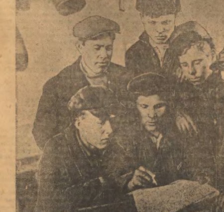
Зарничная группа комсомольца г. Шинского, в Сумасном здании, проинформированное здание объединено выделено на 250—300 руб. На снимке: Шинский в обложном парике читает комсомольцам своей группы доклад тов. Носорова на X съезде ВЛКСМ. (Фото Дубокова).

Секретарь Крайкома ВКП(б) СЕРГЕЕВ. (ЗиневТАСС).