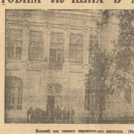
Внешний вид главного педагогического института. (Фото Нестеров).

Внешний вид главного педагогического института. (Фото Нестеров). В настоящее время институт имеет 4-летний курс обучения. Институт имеет 5 факультетов с 6 специальностями: 1) история, 2) литература и русский язык, 3) физика, 4) математика, 5) естественные и социальные науки. Институт имеет 5 факультетов с 6 специальностями: 1) история, 2) литература и русский язык, 3) физика, 4) математика, 5) естественные и социальные науки. Институт имеет 5 факультетов с 6 специальностями: 1) история, 2) литература и русский язык, 3) физика, 4) математика, 5) естественные и социальные науки.