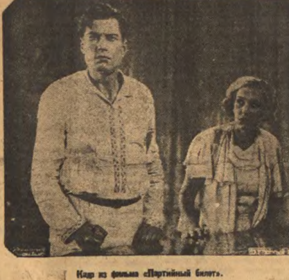
Кадр из фильма «Партийный билет».