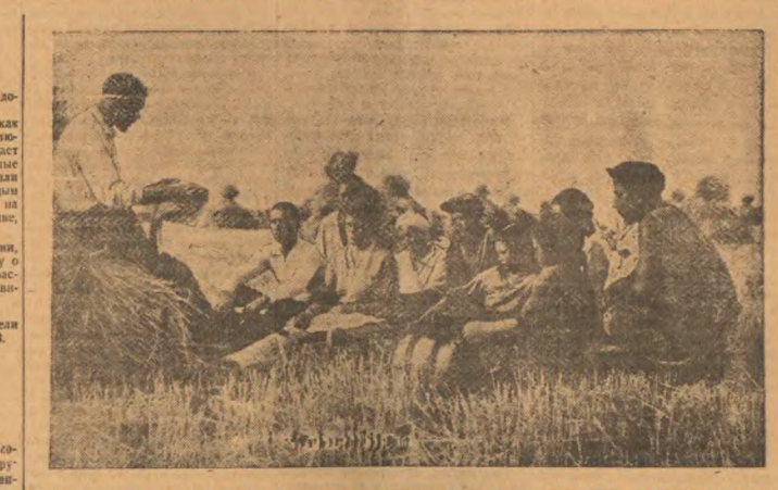
На полях, в бригадах, на широтах изобилия Крыма идет широкое движение обсуждения проекта новой Конституции.