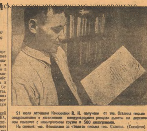
21 июля летчиком Иосифом В. И. получено от тов. Сталина письмо с благодарностью в отношении исполнения ролей пилота на протяжении всего маршрута с количеством часов в 500 километров.

Выступая на митинге, выступил представитель интернационального комитета международного движения за мир, представляющий в Брюсселе, выступил Клеппер Лангштерн.