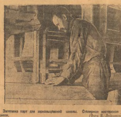
Заготовка лат для зорильцевской школы. Сидящая мастерица при.

Испанская земля после установления фашистского режима переживает тяжелые времена. Военно-фашистский мятеж в Испании.