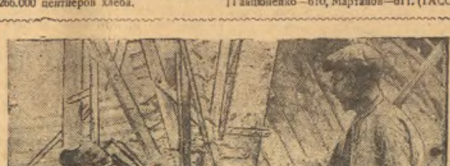
Привоз убоочных машин на колхозной кучнице в колхозе «Красный строитель», Зерновский сельсовет. Бригады: бригады 2/1 бригады 3/1 бригады 4/1 бригады 5/1 бригады 6/1 бригады 7/1 бригады 8/1 бригады 9/1 бригады 10/1 бригады 11/1 бригады 12/1 бригады 13/1 бригады 14/1 бригады 15/1 бригады 16/1 бригады 17/1 бригады 18/1 бригады 19/1 бригады 20/1 бригады 21/1 бригады 22/1 бригады 23/1 бригады 24/1 бригады 25/1 бригады 26/1 бригады 27/1 бригады 28/1 бригады 29/1 бригады 30/1 бригады 31/1 бригады 32/1 бригады 33/1 бригады 34/1 бригады 35/1 бригады 36/1 бригады 37/1 бригады 38/1 бригады 39/1 бригады 40/1 бригады 41/1 бригады 42/1 бригады 43/1 бригады 44/1 бригады 45/1 бригады 46/1 бригады 47/1 бригады 48/1 бригады 49/1 бригады 50/1 бригады 51/1 бригады 52/1 бригады 53/1 бригады 54/1 бригады 55/1 бригады 56/1 бригады 57/1 бригады 58/1 бригады 59/1 бригады 60/1 бригады 61/1 бригады 62/1 бригады 63/1 бригады 64/1 бригады 65/1 бригады 66/1 бригады 67/1 бригады 68/1 бригады 69/1 бригады 70/1 бригады 71/1 бригады 72/1 бригады 73/1 бригады 74/1 бригады 75/1 бригады 76/1 бригады 77/1 бригады 78/1 бригады 79/1 бригады 80/1 бригады 81/1 бригады 82/1 бригады 83/1 бригады 84/1 бригады 85/1 бригады 86/1 бригады 87/1 бригады 88/1 бригады 89/1 бригады 90/1 бригады 91/1 бригады 92/1 бригады 93/1 бригады 94/1 бригады 95/1 бригады 96/1 бригады 97/1 бригады 98/1 бригады 99/1 бригады 100/1 бригады 101/1 бригады 102/1 бригады 103/1 бригады 104/1 бригады 105/1 бригады 106/1 бригады 107/1 бригады 108/1 бригады 109/1 бригады 110/1 бригады 111/1 бригады 112/1 бригады 113/1 бригады 114/1 бригады 115/1 бригады 116/1 бригады 117/1 бригады 118/1 бригады 119/1 бригады 120/1 бригады 121/1 бригады 122/1 бригады 123/1 бригады 124/1 бригады 125/1 бригады 126/1 бригады 127/1 бригады 128/1 бригады 129/1 бригады 130/1 бригады 131/1 бригады 132/1 бригады 133/1 бригады 134/1 бригады 135/1 бригады 136/1 бригады 137/1 бригады 138/1 бригады 139/1 бригады 140/1 бригады 141/1 бригады 142/1 бригады 143/1 бригады 144/1 бригады 145/1 бригады 146/1 бригады 147/1 бригады 148/1 бригады 149/1 бригады 150/1 бригады 151/1 бригады 152/1 бригады 153/1 бригады 154/1 бригады 155/1 бригады 156/1 бригады 157/1 бригады 158/1 бригады 159/1 бригады 160/1 бригады 161/1 бригады 162/1 бригады 163/1 бригады 164/1 бригады 165/1 бригады 166/1 бригады 167/1 бригады 168/1 бригады 169/1 бригады 170/1 бригады 171/1 бригады 172/1 бригады 173/1 бригады 174/1 бригады 175/1 бригады 176/1 бригады 177/1 бригады 178/1 бригады 179/1 бригады 180/1 бригады 181/1 бригады 182/1 бригады 183/1 бригады 184/1 бригады 185/1 бригады 186/1 бригады 187/1 бригады 188/1 бригады 189/1 бригады 190/1 бригады 191/1 бригады 192/1 бригады 193/1 бригады 194/1 бригады 195/1 бригады 196/1 бригады 197/1 бригады 198/1 бригады 199/1 бригады 200/1 бригады 201/1 бригады 202/1 бригады 203/1 бригады 204/1 бригады 205/1 бригады 206/1 бригады 207/1 бригады 208/1 бригады 209/1 бригады 210/1 бригады 211/1 бригады 212/1 бригады 213/1 бригады 214/1 бригады 215/1 бригады 216/1 бригады 217/1 бригады 218/1 бригады 219/1 бригады 220/1 бригады 221/1 бригады 222/1 бригады 223/1 бригады 224/1 бригады 225/1 бригады 226/1 бригады 227/1 бригады 228/1 бригады 229/1 бригады 230/1 бригады 231/1 бригады 232/1 бригады 233/1 бригады 234/1 бригады 235/1 бригады 236/1 бригады 237/1 бригады 238/1 бригады 239/1 бригады 240/1 бригады 241/1 бригады 242/1 бригады 243/1 бригады 244/1 бригады 245/1 бригады 246/1 бригады 247/1 бригады 248/1 бригады 249/1 бригады 250/1 бригады 251/1 бригады 252/1 бригады 253/1 бригады 254/1 бригады 255/1 бригады 256/1 бригады 257/1 бригады 258/1 бригады 259/1 бригады 260/1 бригады 261/1 бригады 262/1 бригады 263/1 бригады 264/1 бригады 265/1 бригады 266/1 бригады 267/1 бригады 268/1 бригады 269/1 бригады 270/1 бригады 271/1 бригады 272/1 бригады 273/1 бригады 274/1 бригады 275/1 бригады 276/1 бригады 277/1 бригады 278/1 бригады 279/1 бригады 280/1 бригады 281/1 бригады 282/1 бригады 283/1 бригады 284/1 бригады 285/1 бригады 286/1 бригады 287/1 бригады 288/1 бригады 289/1 бригады 290/1 бригады 291/1 бригады 292/1 бригады 293/1 бригады 294/1 бригады 295/1 бригады 296/1 бригады 297/1 бригады 298/1 бригады 299/1 бригады 300/1 бригады 301/1 бригады 302/1 бригады 303/1 бригады 304/1 бригады 305/1 бригады 306/1 бригады 307/1 бригады 308/1 бригады 309/1 бригады 310/1 бригады 311/1 бригады 312/1 бригады 313/1 бригады 314/1 бригады 315/1 бригады 316/1 бригады 317/1 бригады 318/1 бригады 319/1 бригады 320/1 бригады 321/1 бригады 322/1 бригады 323/1 бригады 324/1 бригады 325/1 бригады 326/1 бригады 327/1 бригады 328/1 бригады 329/1 бригады 330/1 бригады 331/1 бригады 332/1 бригады 333/1 бригады 334/1 бригады 335/1 бригады 336/1 бригады 337/1 бригады 338/1 бригады 339/1 бригады 340/1 бригады 341/1 бригады 342/1 бригады 343/1 бригады 344/1 бригады 345/1 бригады 346/1 бригады 347/1 бригады 348/1 бригады 349/1 бригады 350/1 бригады 351/1 бригады 352/1 бригады 353/1 бригады 354/1 бригады 355/1 бригады 356/1 бригады 357/1 бригады 358/1 бригады 359/1 бригады 360/1 бригады 361/1 бригады 362/1 бригады 363/1 бригады 364/1 бригады 365/1 бригады 366/1 бригады 367/1 бригады 368/1 бригады 369/1 бригады 370/1 бригады 371/1 бригады 372/1 бригады 373/1 бригады 374/1 бригады 375/1 бригады 376/1 бригады 377/1 бригады 378/1 бригады 379/1 бригады 380/1 бригады 381/1 бригады 382/1 бригады 383/1 бригады 384/1 бригады 385/1 бригады 386/1 бригады 387/1 бригады 388/1 бригады 389/1 бригады 390/1 бригады 391/1 бригады 392/1 бригады 393/1 бригады 394/1 бригады 395/1 бригады 396/1 бригады 397/1 бригады 398/1 бригады 399/1 бригады 400/1 бригады 401/1 бригады 402/1 бригады 403/1 бригады 404/1 бригады 405/1 бригады 406/1 бригады 407/1 бригады 408/1 бригады 409/1 бригады 410/1 бригады 411/1 бригады 412/1 бригады 413/1 бригады 414/1 бригады 415/1 бригады 416/1 бригады 417/1 бригады 418/1 бригады 419/1 бригады 420/1 бригады 421/1 бригады 422/1 бригады 423/1 бригады 424/1 бригады 425/1 бригады 426/1 бригады 427/1 бригады 428/1 бригады 429/1 бригады 430/1 бригады 431/1 бригады 432/1 бригады 433/1 бригады 434/1 бригады 435/1 бригады 436/1 бригады 437/1 бригады 438/1 бригады 439/1 бригады 440/1 бригады 441/1 бригады 442/1 бригады 443/1 бригады 444/1 бригады 445/1 бригады 446/1 бригады 447/1 бригады 448/1 бригады 449/1 бригады 450/1 бригады 451/1 бригады 452/1 бригады 453/1 бригады 454/1 бригады 455/1 бригады 456/1 бригады 457/1 бригады 458/1 бригады 459/1 бригады 460/1 бригады 461/1 бригады 462/1 бригады 463/1 бригады 464/1 бригады 465/1 бригады 466/1 бригады 467/1 бригады 468/1 бригады 469/1 бригады 470/1 бригады 471/1 бригады 472/1 бригады 473/1 бригады 474/1 бригады 475/1 бригады 476/1 бригады 477/1 бригады 478/1 бригады 479/1 бригады 480/1 бригады 481/1 бригады 482/1 бригады 483/1 бригады 484/1 бригады 485/1 бригады 486/1 бригады 487/1 бригады 488/1 бригады 489/1 бригады 490/1 бригады 491/1 бригады 492/1 бригады 493/1 бригады 494/1 бригады 495/1 бригады 496/1 бригады 497/1 бригады 498/1 бригады 499/1 бригады 500/1 бригады 501/1 бригады 502/1 бригады 503/1 бригады 504/1 бригады 505/1 бригады 506/1 бригады 507/1 бригады 508/1 бригады 509/1 бригады 510/1 бригады 511/1 бригады 512/1 бригады 513/1 бригады 514/1 бригады 515/1 бригады 516/1 бригады 517/1 бригады 518/1 бригады 519/1 бригады 520/1 бригады 521/1 бригады 522/1 бригады 523/1 бригады 524/1 бригады 525/1 бригады 526/1 бригады 527/1 бригады 528/1 бригады 529/1 бригады 530/1 бригады 531/1 бригады 532/1 бригады 533/1 бригады 534/1 бригады 535/1 бригады 536/1 бригады 537/1 бригады 538/1 бригады 539/1 бригады 540/1 бригады 541/1 бригады 542/1 бригады 543/1 бригады 544/1 бригады 545/1 бригады 546/1 бригады 547/1 бригады 548/1 бригады 549/1 бригады 550/1 бригады 551/1 бригады 552/1 бригады 553/1 бригады 554/1 бригады 555/1 бригады 556/1 бригады 557/1 бригады 558/1 бригады 559/1 бригады 560/1 бригады 561/1 бригады 562/1 бригады 563/1 бригады 564/1 бригады 565/1 бригады 566/1 бригады 567/1 бригады 568/1 бригады 569/1 бригады 570/1 бригады 571/1 бригады 572/1 бригады 573/1 бригады 574/1 бригады 575/1 бригады 576/1 бригады 577/1 бригады 578/1 бригады 579/1 бригады 580/1 бригады 581/1 бригады 582/1 бригады 583/1 бригады 584/1 бригады 585/1 бригады 586/1 бригады 587/1 бригады 588/1 бригады 589/1 бригады 590/1 бригады 591/1 бригады 592/1 бригады 593/1 бригады 594/1 бригады 595/1 бригады 596/1 бригады 597/1 бригады 598/1 бригады 599/1 бригады 600/1 бригады 601/1 бригады 602/1 бригады 603/1 бригады 604/1 бригады 605/1 бригады 606/1 бригады 607/1 бригады 608/1 бригады 609/1 бригады 610/1 бригады 611/1 бригады 612/1 бригады 613/1 бригады 614/1 бригады 615/1 бригады 616/1 бригады 617/1 бригады 618/1 бригады 619/1 бригады 620/1 бригады 621/1 бригады 622/1 бригады 623/1 бригады 624/1 бригады 625/1 бригады 626/1 бригады 627/1 бригады 628/1 бригады 629/1 бригады 630/1 бригады 631/1 бригады 632/1 бригады 633/1 бригады 634/1 бригады 635/1 бригады 636/1 бригады 637/1 бригады 638/1 бригады 639/1 бригады 640/1 бригады 641/1 бригады 642/1 бригады 643/1 бригады 644/1 бригады 645/1 бригады 646/1 бригады 647/1 бригады 648/1 бригады 649/1 бригады 650/1 бригады 651/1 бригады 652/1 бригады 653/1 бригады 654/1 бригады 655/1 бригады 656/1 бригады 657/1 бригады 658/1 бригады 659/1 бригады 660/1 бригады 661/1 бригады 662/1 бригады 663/1 бригады 664/1 бригады 665/1 бригады 666/1 бригады 667/1 бригады 668/1 бригады 669/1 бригады 670/1 бригады 671/1 бригады 672/1 бригады 673/1 бригады 674/1 бригады 675/1 бригады 676/1 бригады 677/1 бригады 678/1 бригады 679/1 бригады 680/1 бригады 681/1 бригады 682/1 бригады 683/1 бригады 684/1 бригады 685/1 бригады 686/1 бригады 687/1 бригады 688/1 бригады 689/1 бригады 690/1 бригады 691/1 бригады 692/1 бригады 693/1 бригады 694/1 бригады 695/1 бригады 696/1 бригады 697/1 бригады 698/1 бригады 699/1 бригады 700/1 бригады 701/1 бригады 702/1 бригады 703/1 бригады 704/1 бригады 705/1 бригады 706/1 бригады 707/1 бригады 708/1 бригады 709/1 бригады 710/1 бригады 711/1 бригады 712/1 бригады 713/1 бригады 714/1 бригады 715/1 бригады 716/1 бригады 717/1 бригады 718/1 бригады 719/1 бригады 720/1 бригады 721/1 бригады 722/1 бригады 723/1 бригады 724/1 бригады 725/1 бригады 726/1 бригады 727/1 бригады 728/1 бригады 729/1 бригады 730/

Всех колхозников одно стремление — закончить сенокос до начала косовицы хлебов. Нехорошо работать первое звено бригады (звеньевый Т. Хмельский). Его звено заготовило сева 256 центнеров, а второе и четвертое звенья только по 200 центнеров. Звено Т. Хмельского за день раньше всех других звеньев приступило к метке сева.